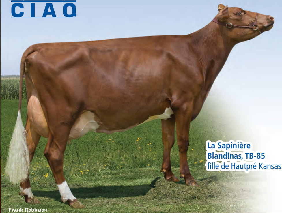
La Sapinière Blandinas, TB-85 fille de Hautpré Kansas